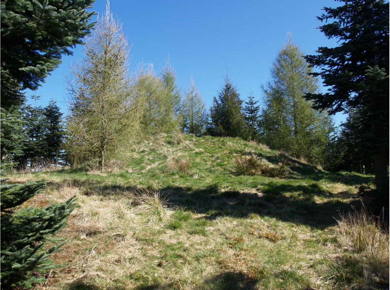
Gravhøj fra bronzealder 1.400 f.Kr. 15 x 15 x 2 m. Nedgravning i top. Fritliggende i ædelgranplantning.

Fredningsnummer 312554 Sognebeskrivelse 020611-113